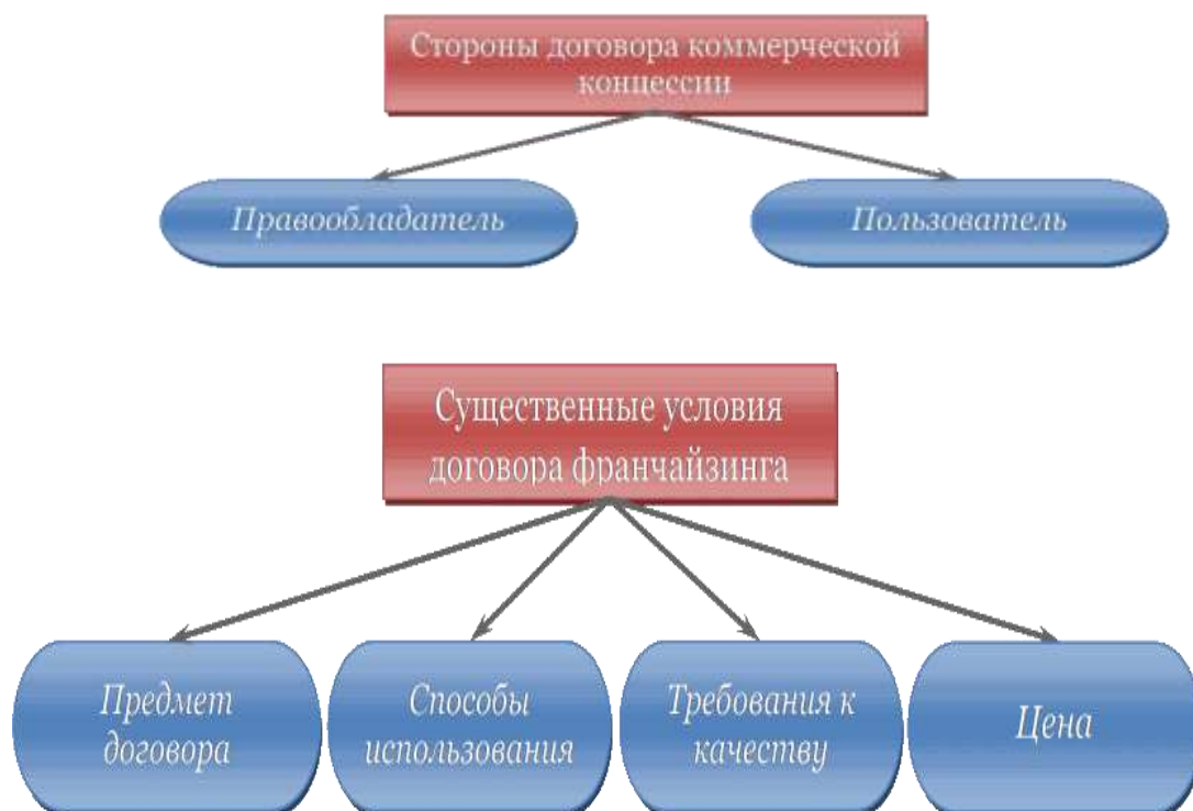
Рисунок 3 – Содержание договора коммерческой концессии

Нумерация листов курсовой работы должна быть сквозной для текста и приложений, начиная с титульного листа. Проставляется нумерация с третьего листа (титульный лист и задание не нумеруются). Номер листа проставляется в справа внизу шрифтом Times New Roman.